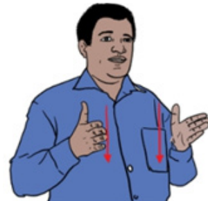
Suntsa k`onc`issiya malaata kifliya misiliyaa

Laamettiya malaatatuwa shaakussanne malaatatuwa eeshshaa akeekussaa.